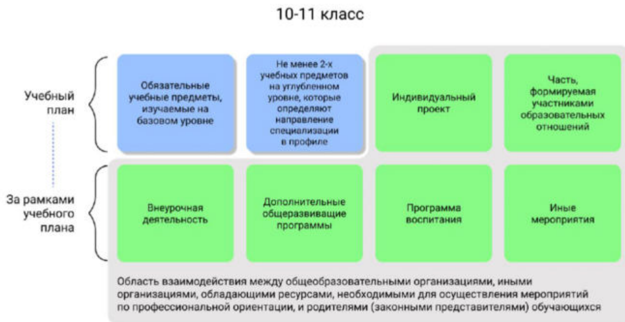
Рисунок 1 – Единая модель профориентации в профильных предпрофессиональных классах – область взаимодействия между общеобразовательными организациями и партнерами

Разработка основной образовательной программы для профильных предпрофессиональных классов проводится с учетом мнения всех категорий участников Единой модели профориентации, представленных на уровне субъекта Российской Федерации, муниципалитета.